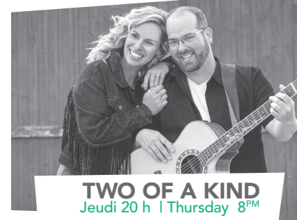
TWO OF A KIND Jeudi 20 h | Thursday 8 PM