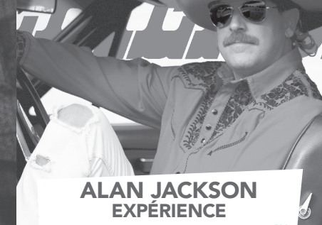
ALAN JACKSON EXPÉRIENCE Samedi 20 h 30 | Saturday 8:30 PM

La barrière ouvre à 12 h jeudi le 24 août